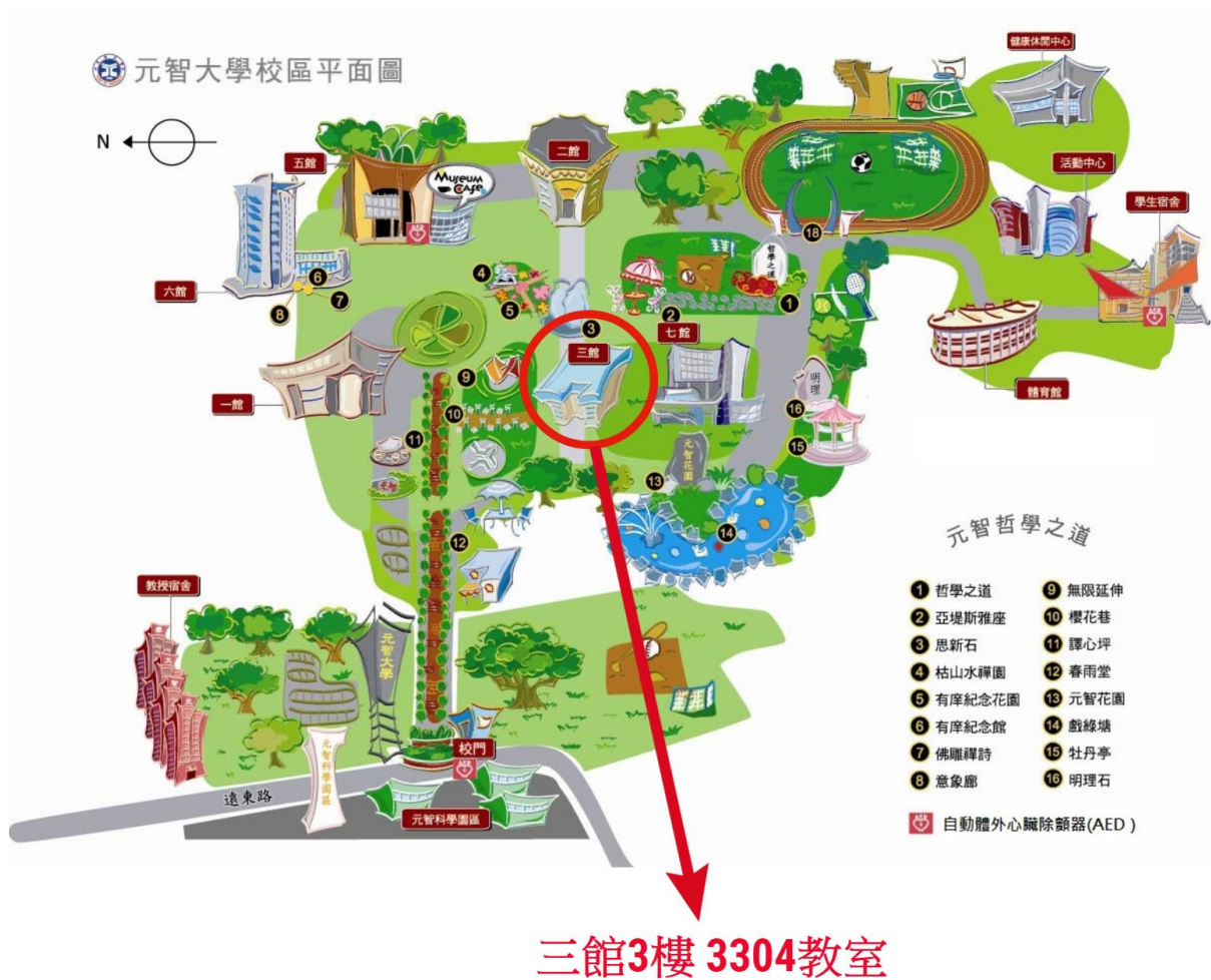
《元智大學校區平面圖》