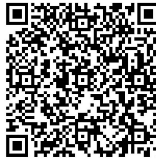
證照獎勵申請 上傳證照影本_不合格範例